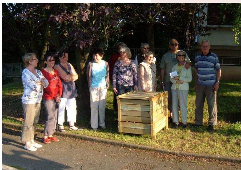
L'inauguration du composteur à la résidence des Conches