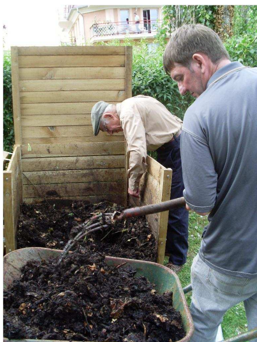
Le transfert du compost dans le bac de maturation à la résidence Saint-Exupéry