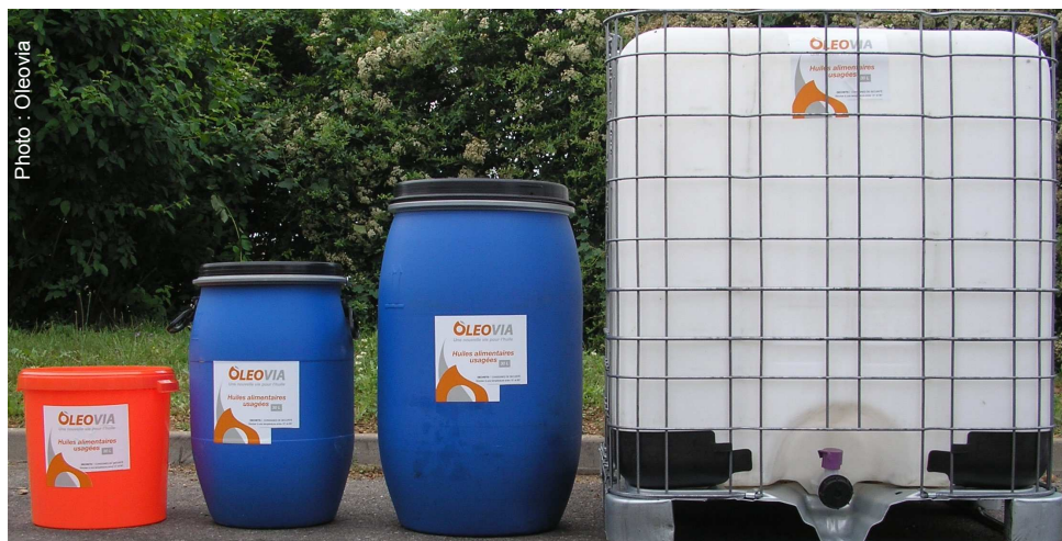
Des contenants de différentes capacités fournis par le prestataire