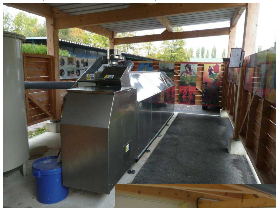
Le composteur installé sur une plateforme couverte