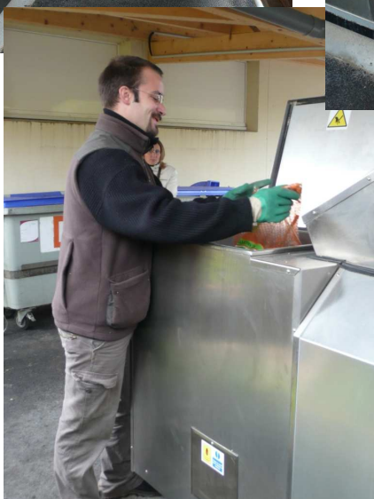
Introduction de déchets biodégradables dans le composteur