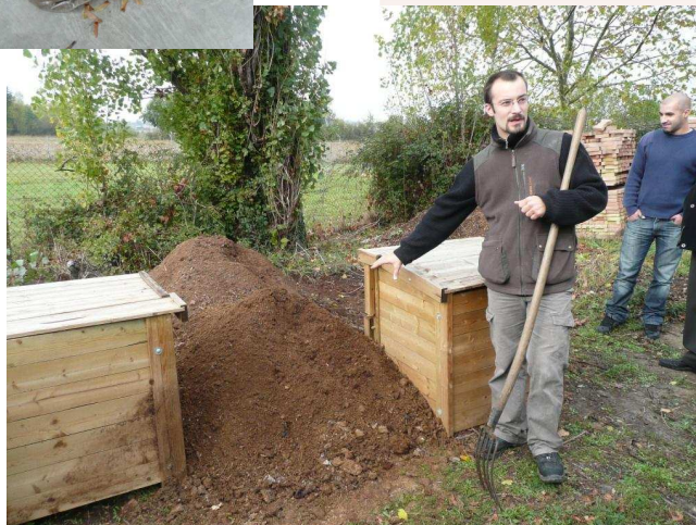
Zone de maturation du compost